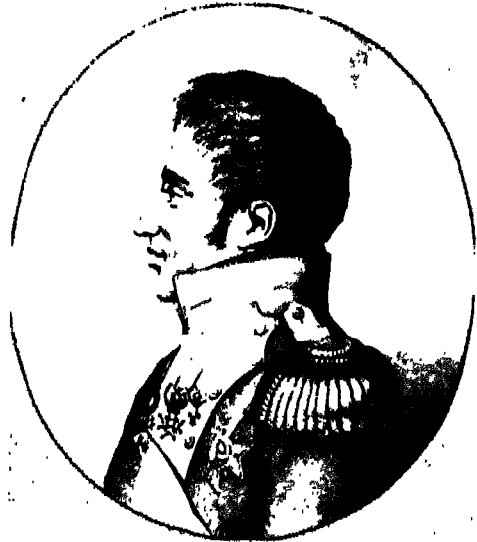
كونت أرتوازي، أخ لويس الثامن عشر الذي سيصبح الملك لويس العاشر.